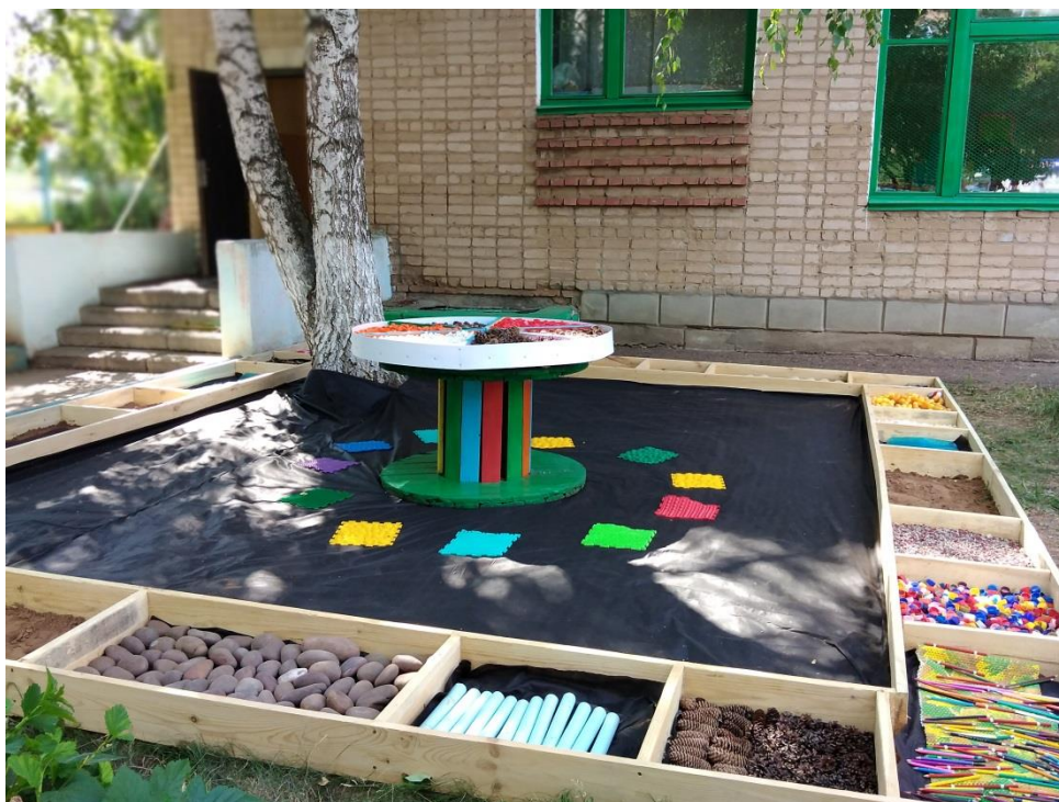
Поверхность с галькой